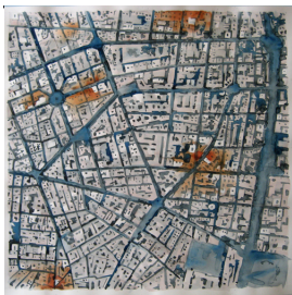
Matteo Marzetti, Agua en chimbabwei rec. 2010. Acquarello su carta, cm 50x50.