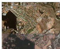
Fig. c: Roma, Tor Pagnotta Est; Fonte: Immagine Google Earth, 2007

L'esigenza di fuggire dalla città dello smog e del caos, delle case vecchie e dei condomini-alveare verso abitazioni che posseggono un giardino e magari un posto auto sicuro, sta spingendo molti ex abitanti della zona centrale o semi periferica verso l'area periurbana, area che ha nell'impianto viario romano e nel G.R.A. il miraggio di un collegamento funzionale con il centro e con il luogo di lavoro (fig. c).