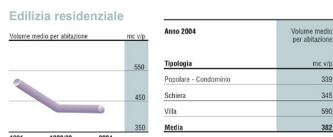
Fig. a: Volume medio per abitazione e tipologia;

Una conferma viene dalla lettura dei dati relativi alla volumetria media per singola abitazione sempre del Cresme, volumetria che dopo aver avuto un forte aumento per tutti gli anni ottanta, a partire dal 1993, primo anno della crisi della svalutazione della lira, ha iniziato a far sentire una diminuzione profonda, continua e costante, passando dai 550 mc. per alloggio nel 1993 a 485 mc. nel 2002, con una diminuzione netta dell'11,8%, pari a una superficie di circa 20 mq. per abitazione.