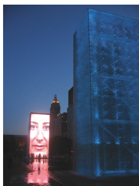
Fig. 5 Crown Fountain, Millenium Park, Chicago.

Nella contemporaneità siamo immersi in una nuvola di informazioni cangianti e mutevoli, dove il motore che ne ha consentito lo sviluppo è costituito dalla digitalizzazione elettronica. In quale modo tutto questo può influire sull'architettura, che per definizione, fino ad oggi è sembrato l'ambito di vita più statico che si potesse immaginare? Probabilmente tramite l'interattività, come per l'architettura di Gropius è stata la trasparenza (Saggio, A., 2005).