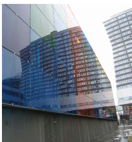
Fig. 1 Ex Gasometro di Vienna: intervento di Coop Himmelblau rispecchiato sulla superficie colorata traslucida dell'edificio prospiciente (Rudiger)

In realtà l'architettura sembra essere cambiata ben poco, perché metafore quali casa e dimora, rifugio, mattoni e malta, fondazioni, tutt'ora testimoniano solidamente il ruolo dell'architettura nella definizione di ciò che consideriamo reale. Da sempre l'architettura è stata la manifestazione del superamento meccanico delle forze naturali come la gravità o il tempo atmosferico. Il paradigma elettronico propone una sfida difficile, perché definisce la realtà attraverso i media e la simulazione, privilegiando l'apparenza rispetto all'esistenza e ciò che si vede rispetto a ciò che è. Tutto questo non più in un modo a noi familiare, ma secondo un punto di vista che non può essere interpretato così agevolmente, perché i media mettono in forse il "come" e il "cosa" noi vediamo.