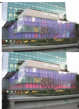
Fig. 4 La Défense, Parigi.

Definizioni e nomi si possono confondere ormai in una miriade di tipologie che variano in funzione della tecnologia di punta adottata per creare stupore, illuminare, comunicare, interagire con il cittadino, il passante e l'inquilino. La domotica, tanto decantata oggi in Italia, potrebbe essere ormai considerata obsoleta rispetto a queste realizzazioni.