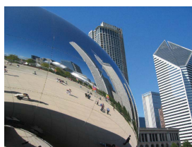
Fig. 2 Cloud Gate sculpture, Anish Kapoor, Millenium Park, Chicago.

L'attuale era dell'elettronica in cui siamo immersi ci induce a non pensare più alla costruzione come arte astratta e ai muri come componenti di una composizione formale strutturata sui canoni della geometria euclidea. Il muro sta assumendo il ruolo di filtro che riceve e trasmette molte informazioni, alla stregua del televisore.