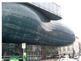
Fig. 3 Peter Cook. Kunsthau Museum Graz.

Nell'interfaccia dello schermo tutto è già presente, dato a vedere dall'immediatezza di una trasmissione istantanea. La facciata-interfaccia del Kunsthau Graz, progettato da Peter Cook e Colin Fournier (Spacelab), ha un nome insolito, breve come l'estensione di un file: BIX.